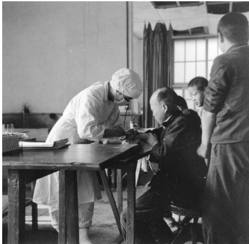
プロミン注射風景 (1957年)