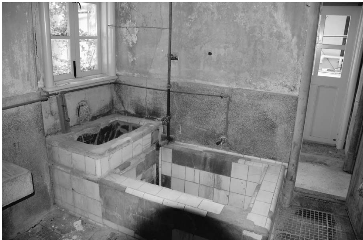
愛生園収容棟（回春寮）の消毒風呂