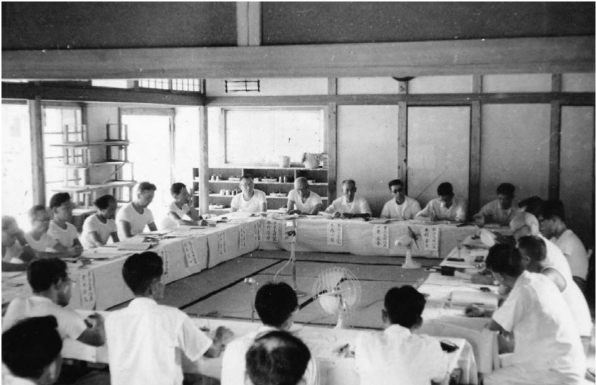
長島愛生園で開催の全患協第4回支部長会議