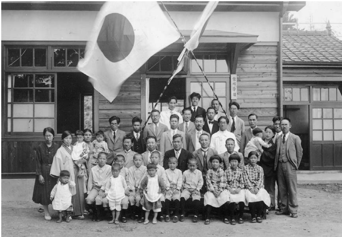
保育児童が学んだ黎明学園