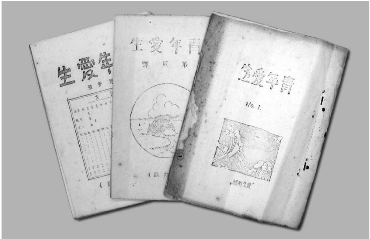
『青年愛生』創刊号～第三号（愛生附録） （1933年、愛生園神谷書庫蔵）