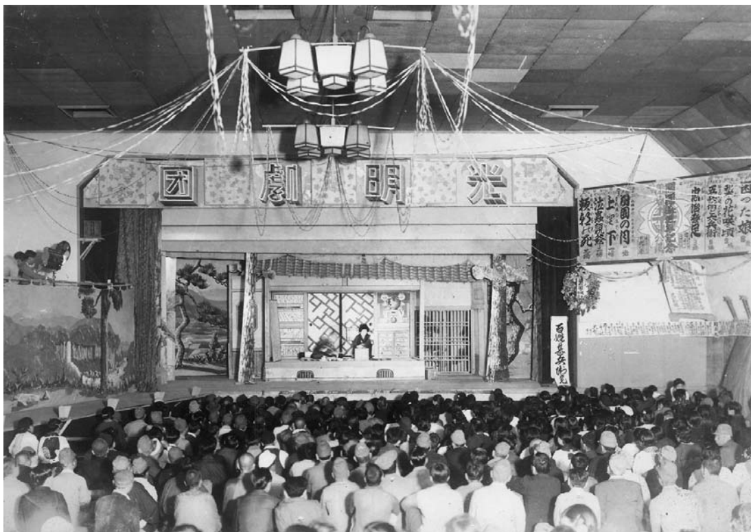
光明劇団の開園十周年記念公演 （1948年、光明自治会蔵）