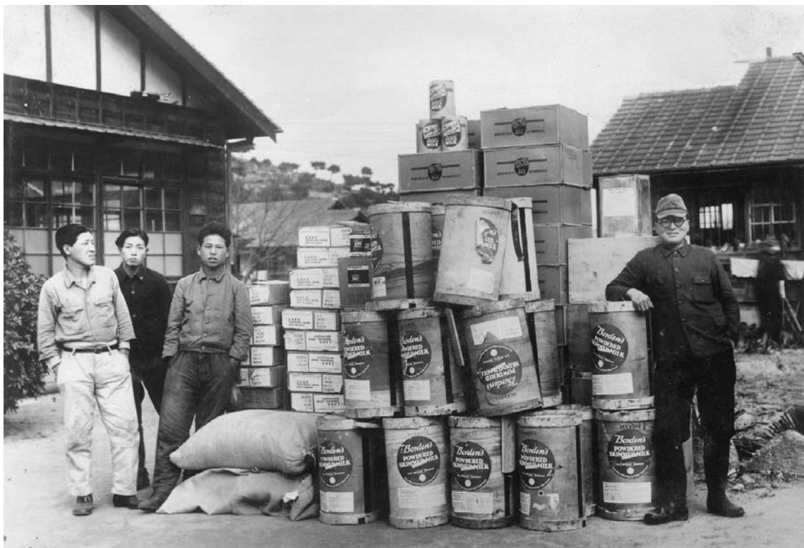
到着したララ物資