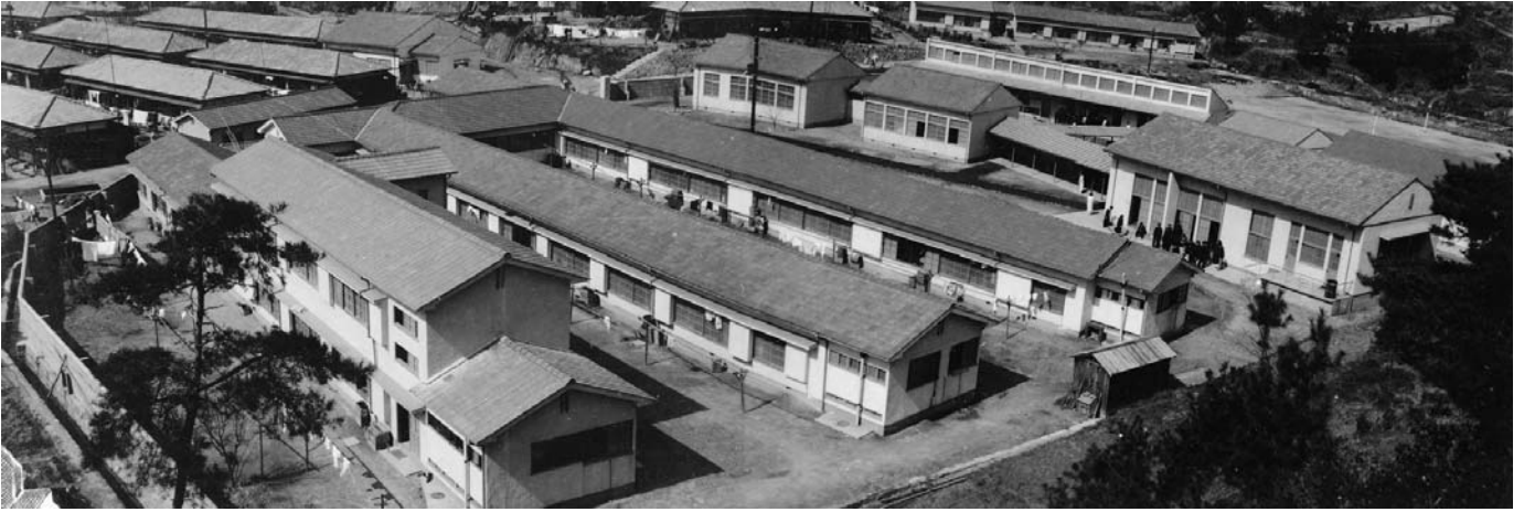
岡山県立邑久高等学校新良田教室 全景